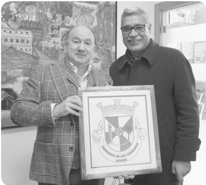
1º Lugar - Farmácia Peixinho

organização, «de uma maneira geral todos mereciam uma distinção, mas temos que escolher três, o que nunca é muito justo». De acordo com o executivo da Junta e colaboradores, «os premiados destacaram-se pela criatividade, empenho aproveitamento de materiais».