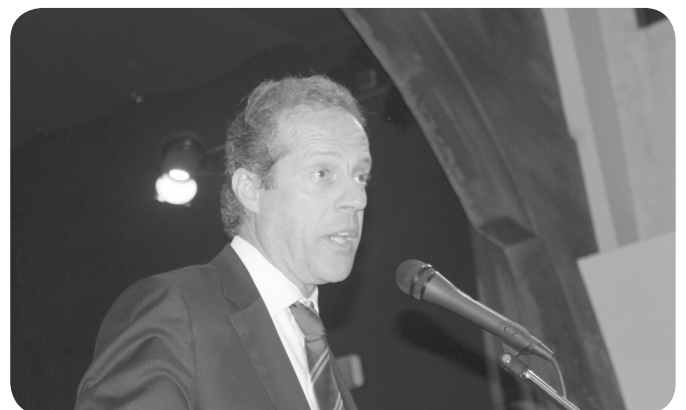
Presidente da CMA parabeniza Freguesia