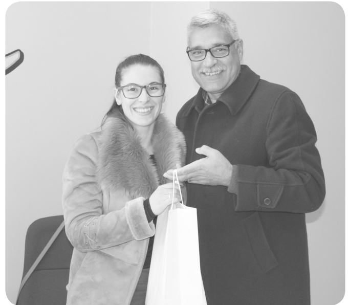
3º Lugar - XTemas

São prémios simbólicos e que pretendem apenas marcar o concurso espontâneo e quase informal que a Junta promove na quadra natalícia. Todas as empresas estão a concurso, exceto as que façam chegar a sua vontade de não participar. Avaliando a criatividade, o empenho e a utilização de matérias recicláveis, os prémios foram distribuídos pela Farmácia Peixinho, TraquinasKids e Xtemas. Segundo a