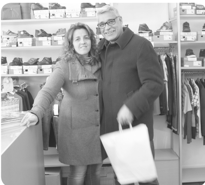
2º Lugar - TraquinasKids