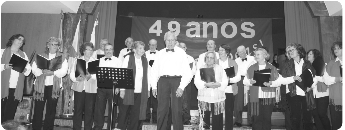
Atuação do Centro de Animação Comunitária