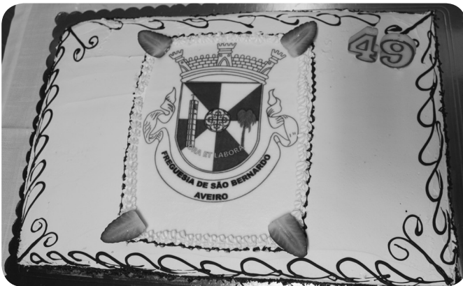
O Bolo de aniversário partilhado por todos