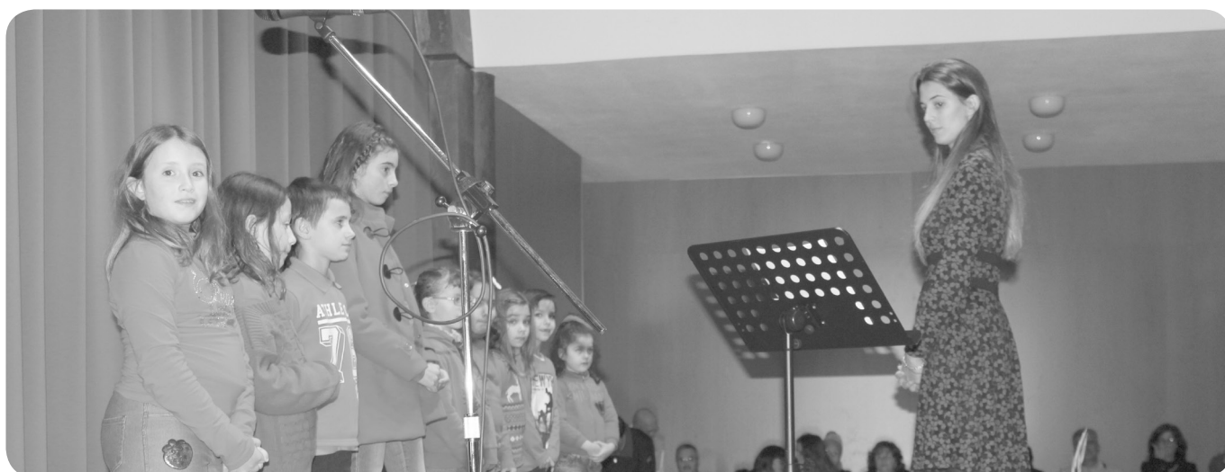
Atuação do Coro Infantil da Sociedade Musical Santa Cecília