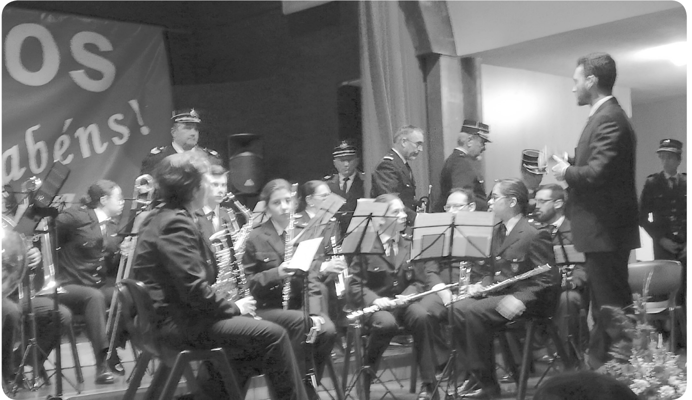
Atuação da Associação Musical e Cultural São Bernardo