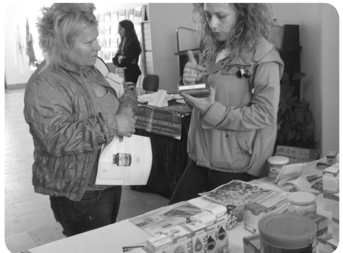
Energia em Equilíbrio mostra produtos naturais