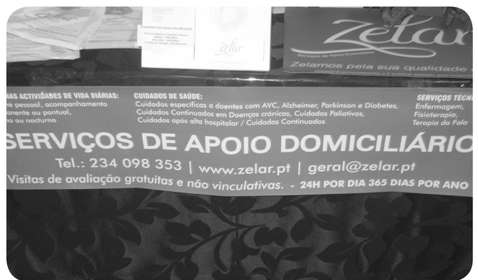
Zelar, empresa de apoio domiciliário