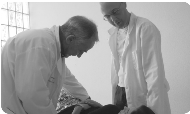
Terapêutas da ORIGENS Terapia