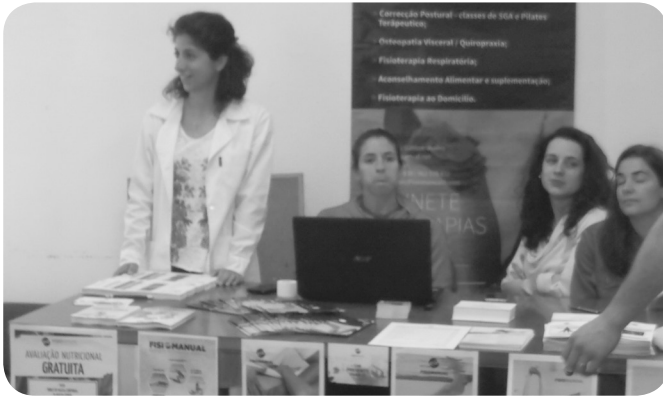
Fisomanual com equipa multifacetada