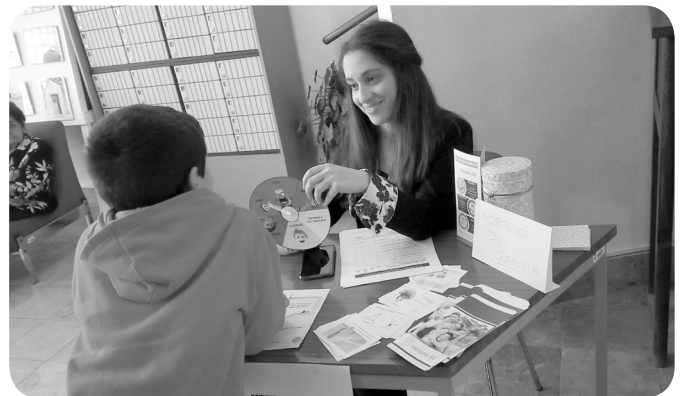
NeuroAV estimula emoções