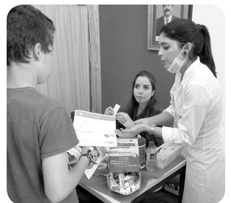
Fiso da UA, Centro de Haloterapia de Aveiro e Clínica de Medicina Dentária Lacerda