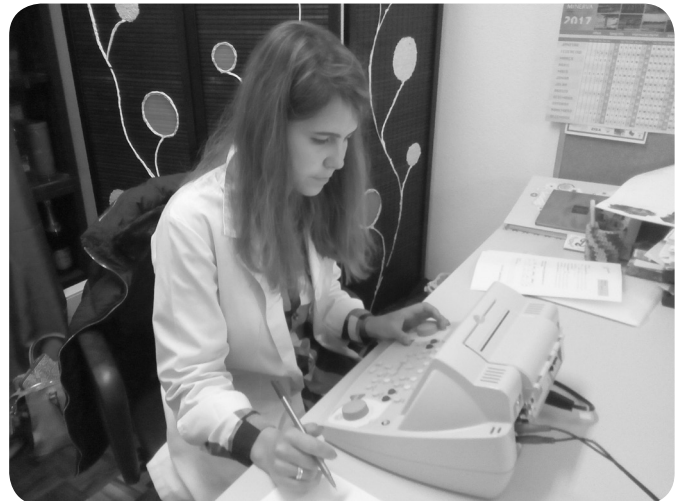
Outono Sentido nos rastreios à audição