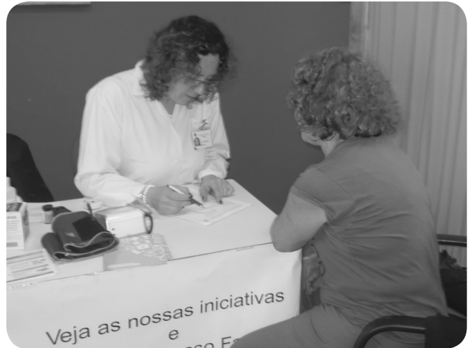
Farmácia Peixinho presente desde a primeira edição

Esta edição contou com rastreios à visão, audição, postura, centro gravitacional, risco de diabetes, tensão arterial, glicémia, obesidade, fisioterapia, saúde oral, podologia, linguagem e fala infantil, nutrição e mostras de massoterapias, produtos naturais, quiroprática, reiki, cristais, medicina tradicional chinesa e exercícios físicos orientados para a correção e/ou melhoria da condição física.