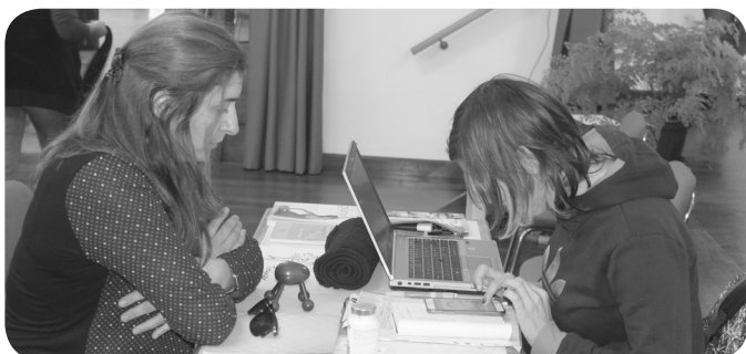
Lia Personal Trainer – Por uma vida saudável