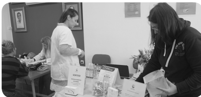
Dentalria – mostra de medicina dentária