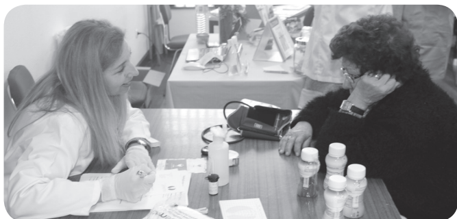
Farmácia Peixinho com rastreios à Glicémia, Tensão Arterial e outros.