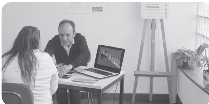
Centro Óptico Aveirense - rastreios visão