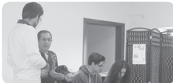
Gabinete de Fisioterapia da Universidade de Aveiro