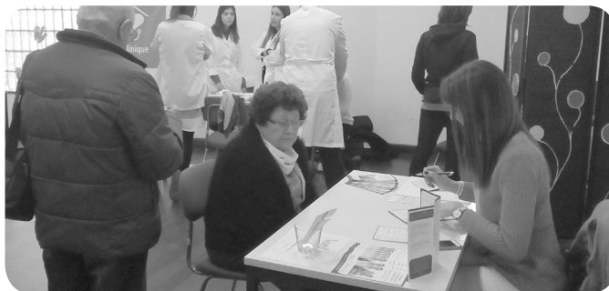
NeuroLiving, com rastreios memória +65