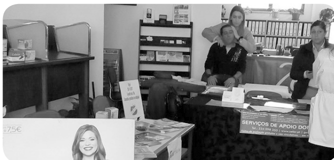
Consulta de nutricionismo pela Dieta Biotrês