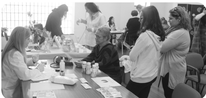
Momentos da IX edição