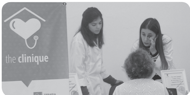
The Clinique com informação, rastreios e acupuntura.