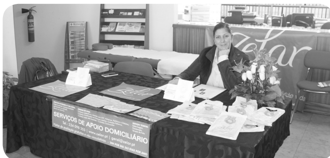
Zelar, Apoio Domiciliário