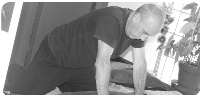
Stimulus com demonstração de Massoterapia