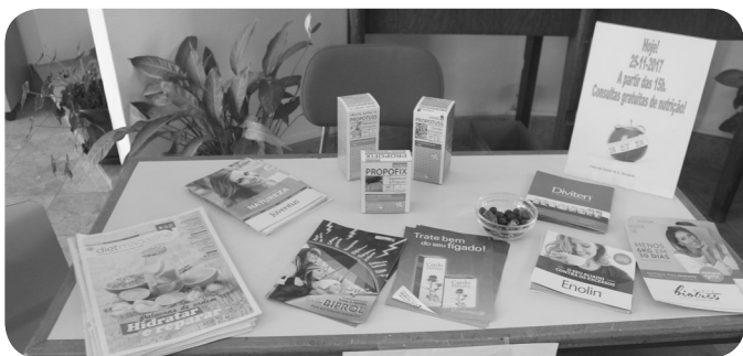
Natur Ria, mostra de produtos naturais e Dieta Biotrês