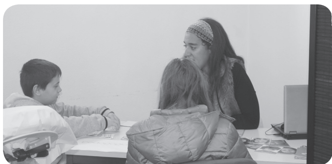
PEDAGOGIAS, Mara Galante