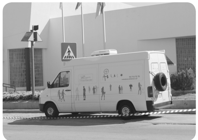
Abraço, com rastreios de Hepatites, HIV e Sífilis