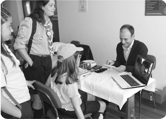
COA, com rastreios de visão