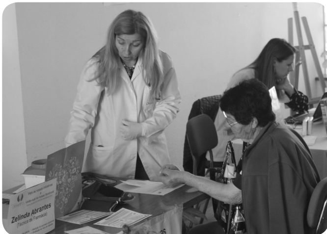
Farmácia Peixinho, com rastreios de tensão arterial, glicémia, entre outros