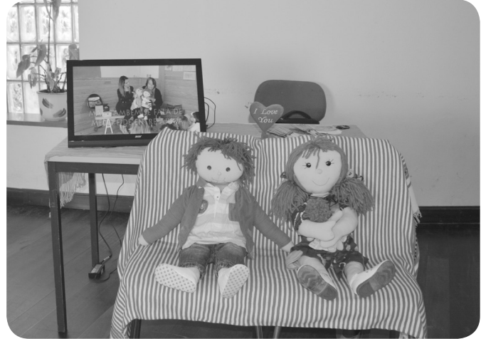
Projeto a Materninha vai Ser Mãe