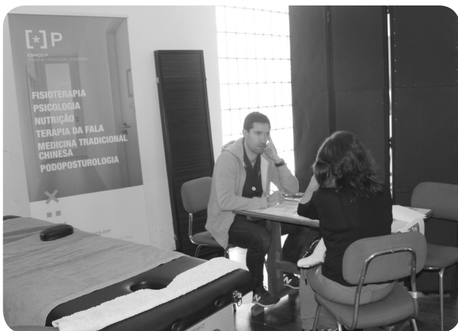
Espaço P, com rastreios de postura e centro gravitacional

A próxima Feira da Saúde deverá acontecer em dezembro deste ano.