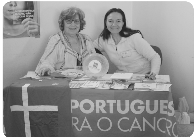
Grupo de Voluntários Comunitário de Aveiro da Liga Portuguesa Contra o Cancro