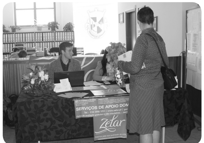
Zelar com mostra cuidados domiciliares