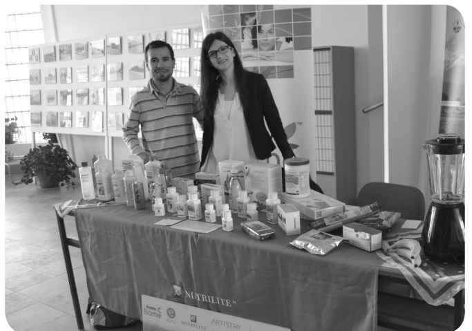
EcoFeelTeam, promoção saúde ambiental e alimentar