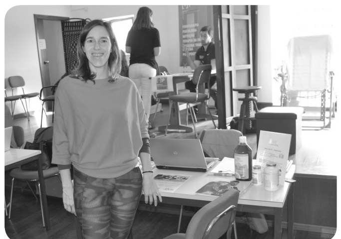
Lia Personal Trainer, promoção atividade física