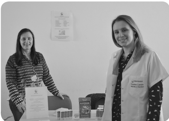
Dentalia, promoção saúde oral