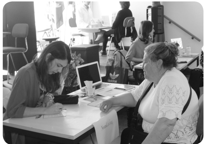
Neuroliving com rastreio de memória 65+