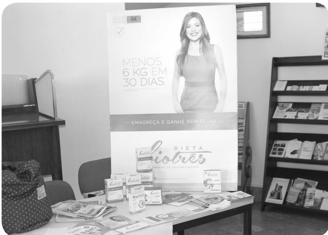
Natur Ria, mostra de produtos naturais