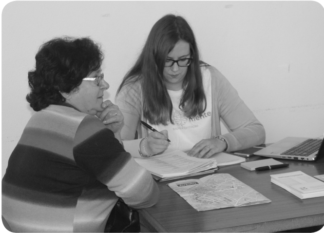
Sistematicamente, rastreios de ansiedade e depressão