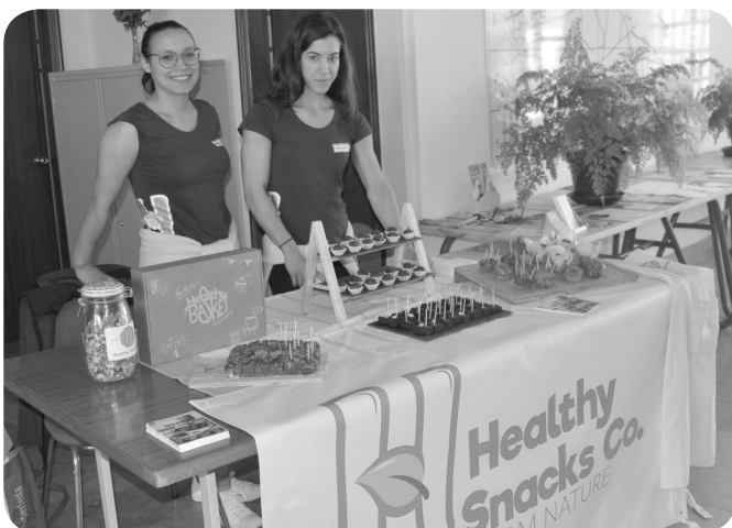
Healthy Snacks, mostra de snacks saudáveis