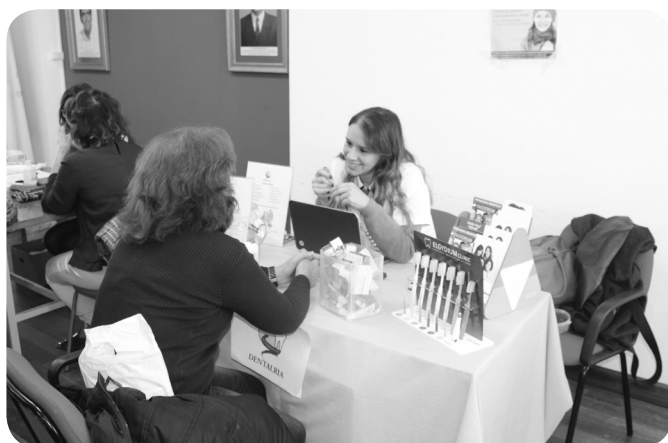
DENTALRIA - Saúde Oral