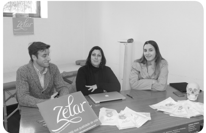
ZELAR - Cuidados Domiciliários