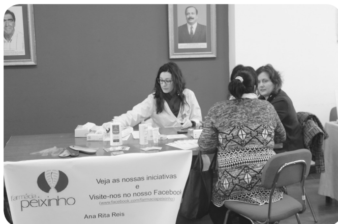
FARMÁCIA PEIXINHO - rastreios Glicémia, Tensão Arterial