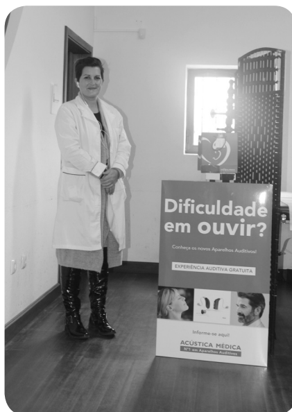
ACÚSTICA MÉDICA - rasterio auditivo