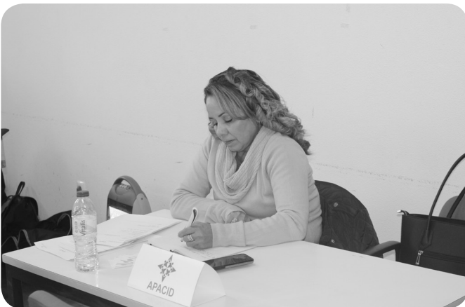
APACID - Apoio aos cuidadores