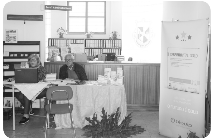
BIOVIP - Suplementos alimentares