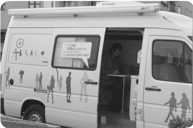
+ Abraço marca, uma vez mais, presença em São Bernardo