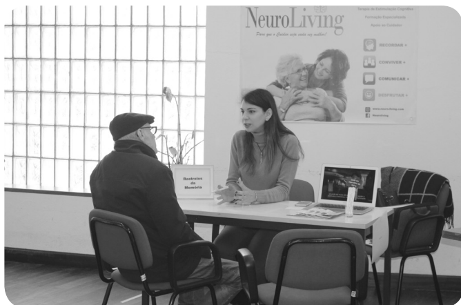
NEUROLIVING - rastreios memória