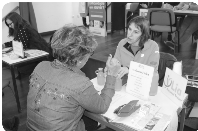
LIA - PERSONAL TRAINER