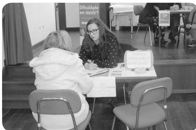
SISTEMATICAMENTE - rastreios ansiedade e depressão