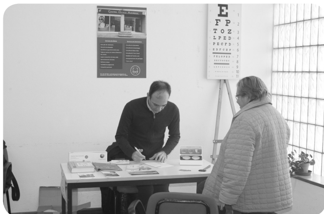
COA - rastreios visão