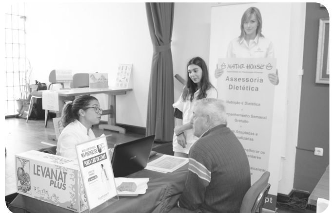
NaturHouse, com consulta de nutrição