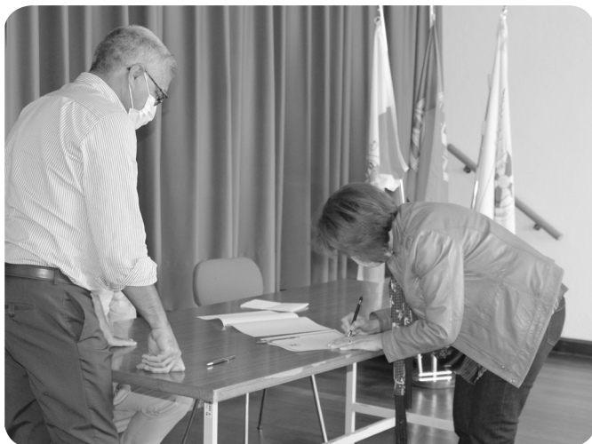
Centro Paroquial São Bernardo