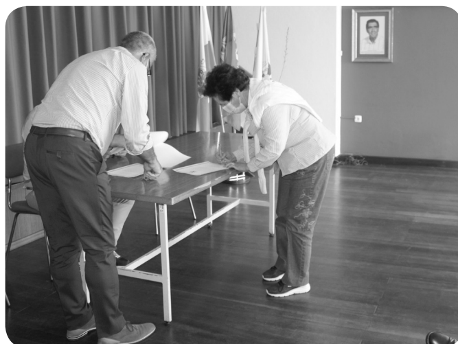
Grupo Cultural São Bernardo a Cantar