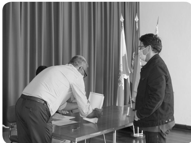
Centro Desportivo SB