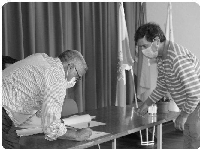
Sociedade Musical Santa Cecília