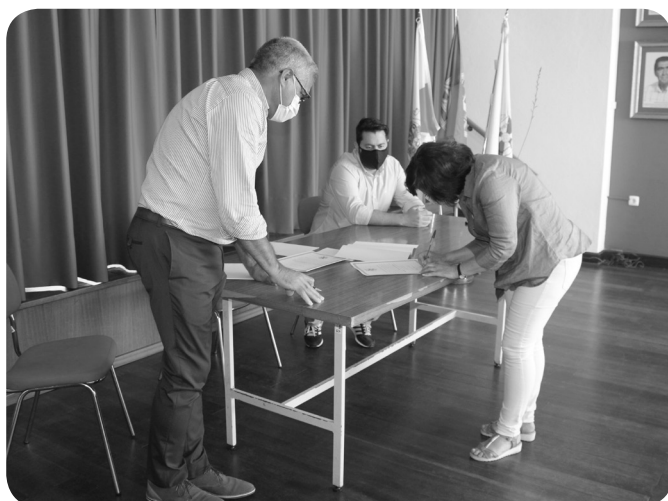
Aplausos Sem Reticências