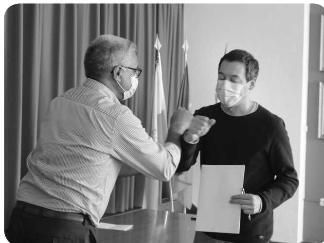
Agrupamento de Escuteiros N.º 1088

associações da Freguesia que após apresentação dos seus planos de atividades e de fazer prova de toda a situação tributária regularizada foram contemplados com um subsídio que «estamos certos será uma almofadinha para os seus projetos promovendo, assim,