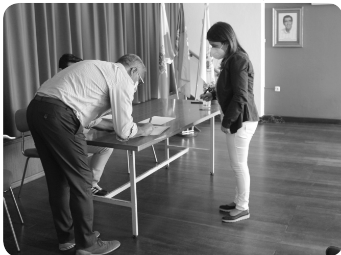
Associação de Pais EB 2/3