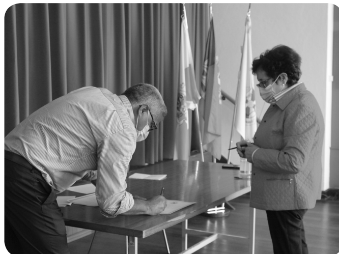
Fundação Padre Félix