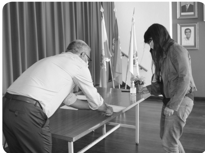
Associação de Pais EB 1