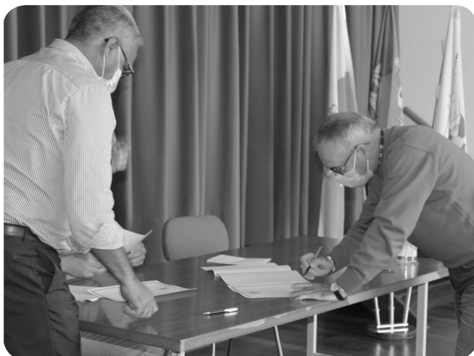
Associação Musical e Cultural SB